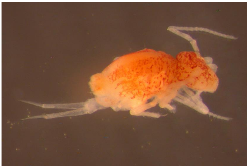
A Pygmarrhopalites aggtelekiensis (Stach, 1929) ugróvillás mindössze 1–1,5 mm-es, a Aggteleki-karszt néhány barlangjának bennszülött faja.

A barlangokban uralkodó életfeltételek egészen különlegesek, és ennek megfelelően az ezekhez alkalmazkodott állatvilág is az. Ennek ellenére eddig a magyarországi barlangok kevesebb mint 1 százalékából ismerünk ugróvillás-adatokat. Pedig a téma izgalmas távlatokat ígér: az alacsony feltártság ellenére is már 17, igazi barlanglakó (troglóbionta) fajt találtunk Magyarországon, amelyek közül 11 csak egyetlen barlangból, vagy egyetlen karsztrendszerből ismert.