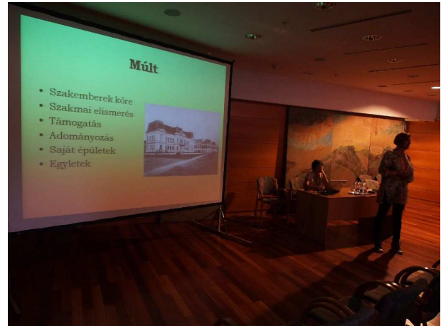
Szítás Éva – Kelet-Szlovákiai Múzeum, Kassa