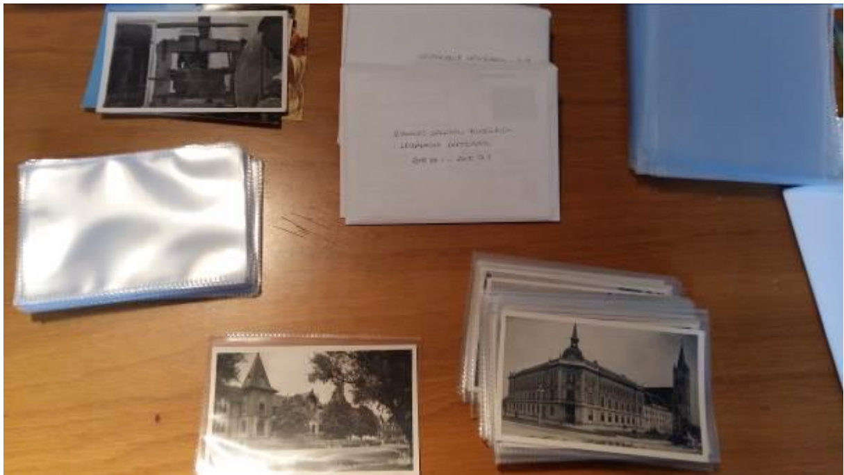
Műanyag tasakok kis alakú képek és képeslapok tárolására és állagvédelmére.